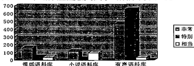
图4.2 三个词作典型程度副词在同一语料库中使用比较图

从图中我们可以看出,在报纸语料库当中,“非常”出现的词数最多,“相当”出现次数少